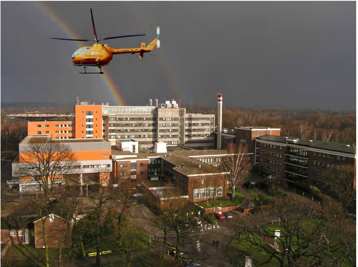
Abbildung: Luftaufnahme der Berufsgenossenschaftlichen Unfallklinik Duisburg GmbH. Der Rettungshubschrauber Christoph 9 ist hier stationiert.